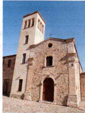
LA CHIESA DI SANTO SPIRITO