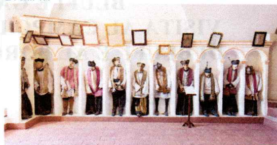
IL CENTRO DI GANGI